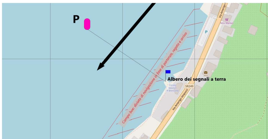
Immagine 3 Linea di arrivo

Linea di arrivo data dall'allineamento fra bandiera blu su albero dei segnali a terra, da tenere a sinistra, e boa di colore FUCSIA P , da tenere a destra.