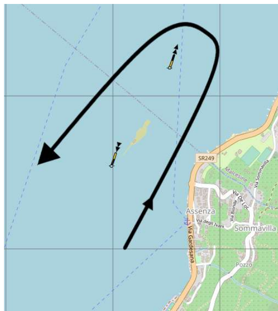
Immagine 2 Passaggio Isola del Trimelone

Divieto di navigazione in fase di pre-partenza, partenza, regata e arrivo nel campo boe del Circolo Nautico Brenzone.