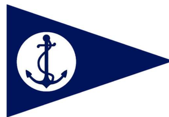
Immagine 1 Linea di partenza