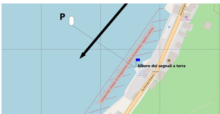
Immagine 3 Linea di arrivo

Linea di arrivo data dall'allineamento fra bandiera blu su albero dei segnali a terra, da tenere a sinistra, e boa di colore BIANCO P , da tenere a destra.