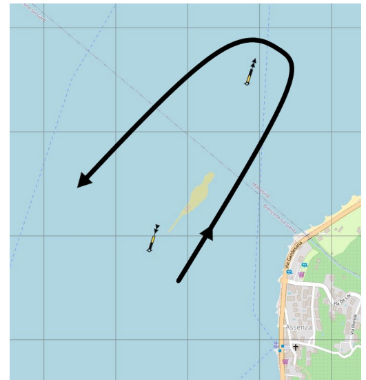
Immagine 2 Passaggio Isola del Trimelone

Divieto di navigazione in fase di pre-partenza, partenza, regata e arrivo nel campo boe del Circolo Nautico Brenzone.